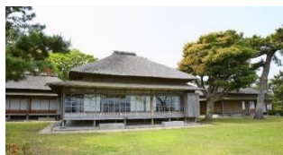
旧伊藤博文金沢別邸