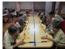
ストローサッカー