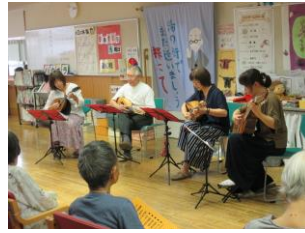
マンドリンアマービレ