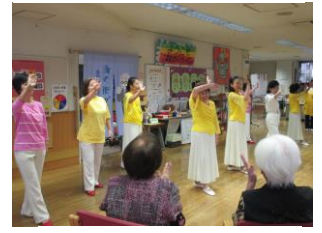
プリュームライン