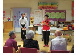
かながわ我楽多一座