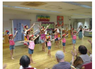
フラレイマカマエ