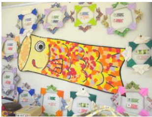
かぶとの折り紙飾り